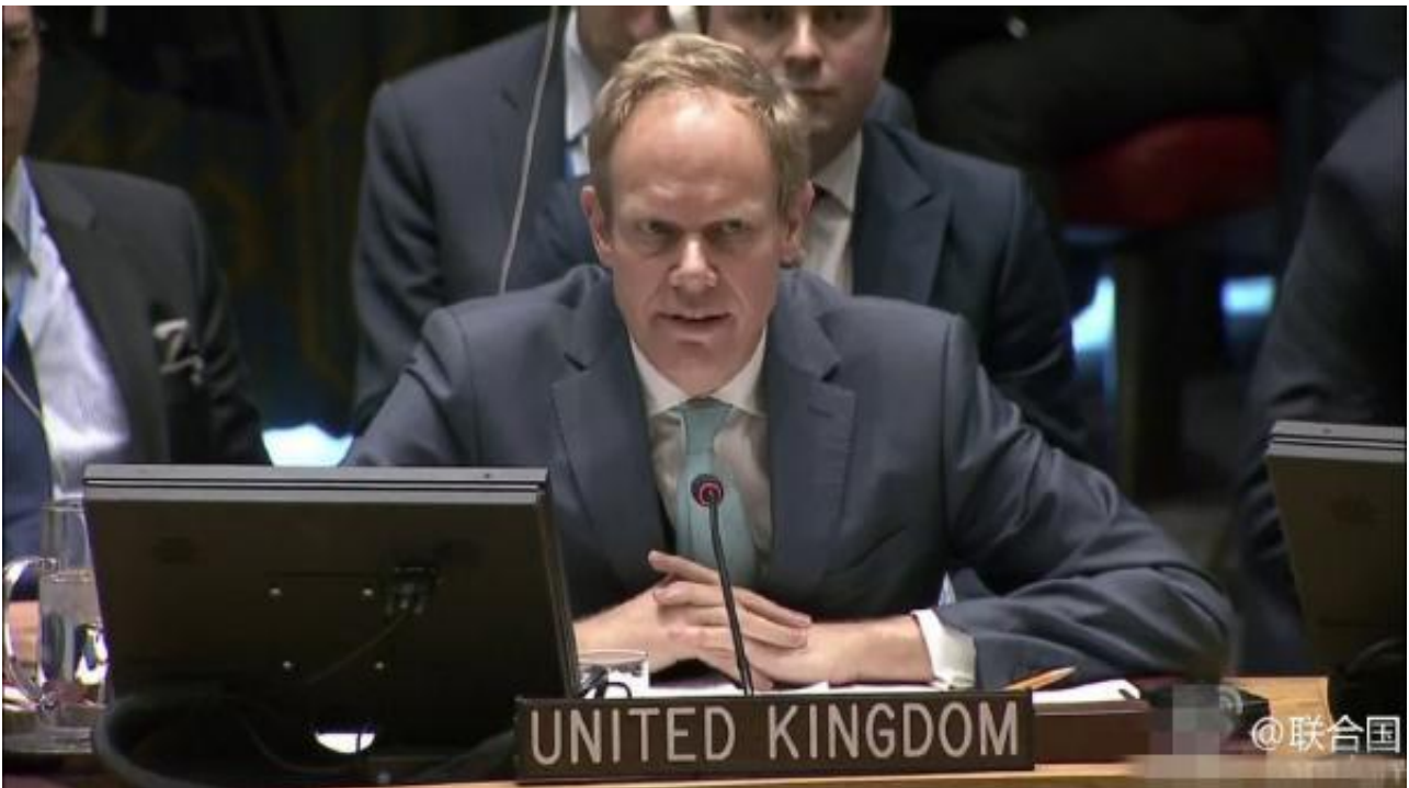
英国常驻联合国代表里克罗夫特

英国常驻联合国代表里克罗夫特表示，俄罗斯不愿意谈判，更愿意支持阿萨德政权。安理会成员致力于维持国际和平与安全，请问俄罗斯的否决如何服务于和平与安全？他还称，英国对中国否决尤其感到意外，他们反复强调不要政治化，主张对话，但是他们却选择和俄罗斯站在一起。