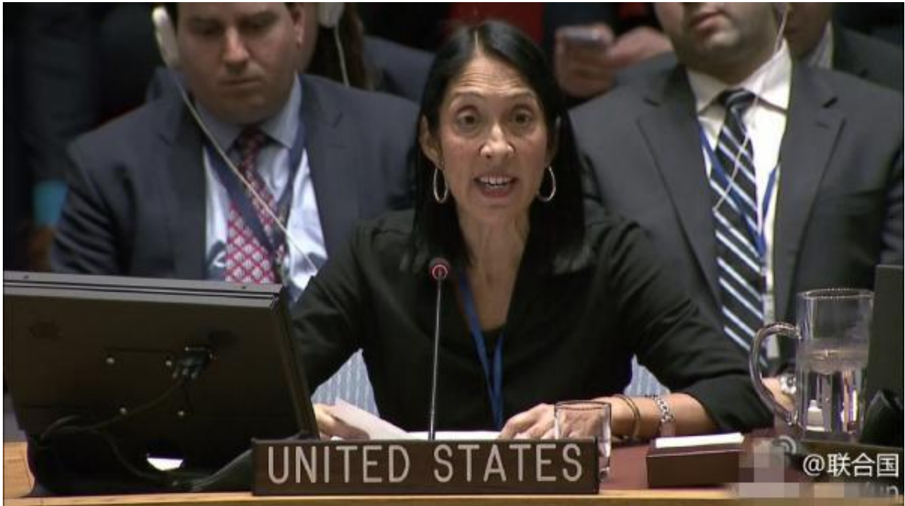
美国常驻联合国副代表西松

针对美国代表的发言，刘结一再次发言表示，叙利亚局势、中东其他国家面临的问题如何发展到今天的地步，起源是什么，有关国家扮演了什么样的角色，发挥了什么样的作用，历史记录是清楚的，安理会成员也十分清楚，这不是在安理会歪曲其他国家的立场可以改变的。