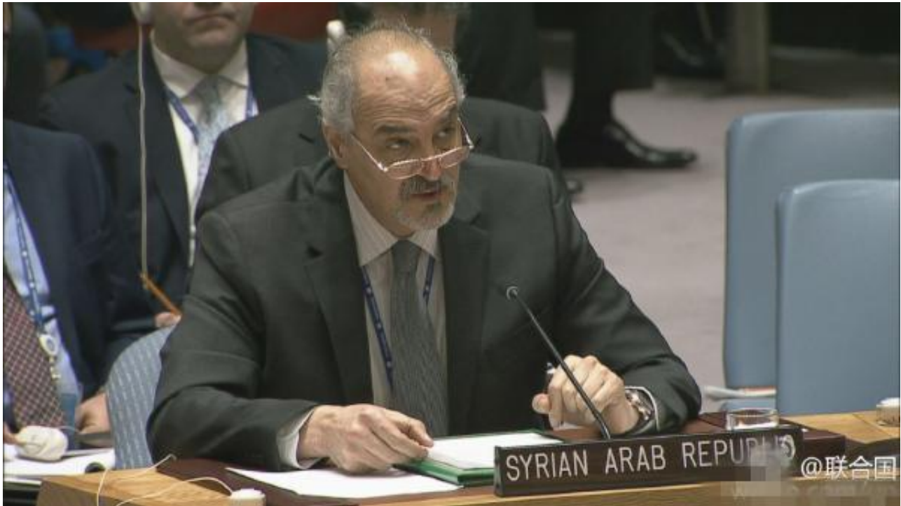
叙利亚常驻联合国代表贾法里