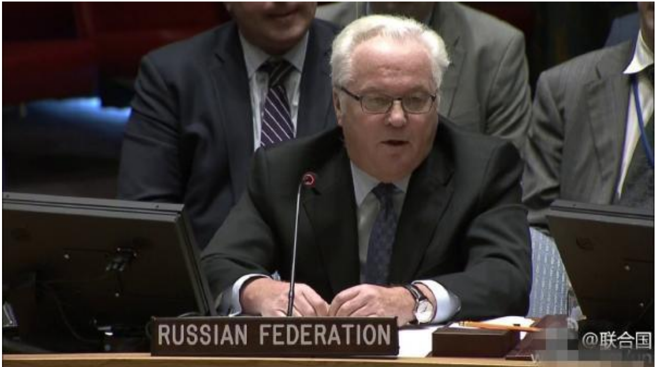
俄罗斯常驻联合国代表维塔利·丘尔金

丘尔金还在会前表示，安理会关于决议草案的投票应推迟到俄美专家会议的召开。此前，美俄两国外长于12月2日商定，就促使武装分子离开阿勒颇的计划举行专家磋商。