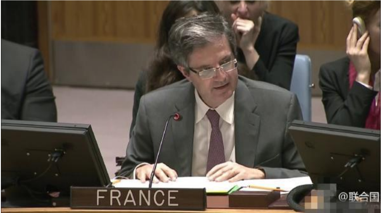
法国常驻联合国代表德拉特则

英国常驻联合国代表里克罗夫特表示，俄罗斯不愿意谈判，更愿意支持阿萨德政权。安理会成员致力于维持国际和平与安全，请问俄罗斯的否决如何服务于和平与安全？他还称，英国对中国否决尤其感到意外，他们反复强调不要政治化，主张对话，但是他们却选择和俄罗斯站在一起。