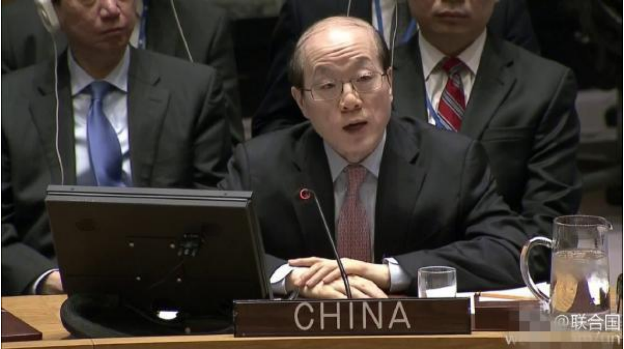
中国常驻联合国代表刘结一

路透社在英文报道中提到，刘结一大使反驳克罗夫特时使用了“poisoning the atmosphere”（“毒害会议气氛”）的表述。