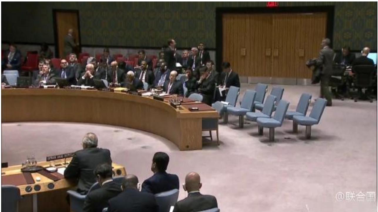
一些国家代表离开了会场

根据联合国安理会规定,任何一项决议要在安理会获得通过需获得15个成员中9个成员的支持,且不能有任何一个常任理事国投反对票。今年10月8日,中国对法国、西班牙起草的叙利亚问题决议草案投弃权票,同时对俄罗斯起草的叙利亚问题决议草案投赞成票。此前,中国曾在2011年10月、2012年2月、7月和2014年5月,四次动用安理会常任理事国的否决权,与俄罗斯一起否决有关叙利亚问题的决议草案。